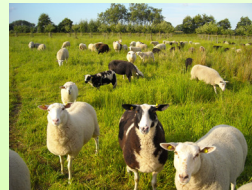
Extensive Beweidung auf dem Sonnenhof