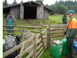
Bau von Wildschutzzäunen in der WfbM SOS Hof Bockum