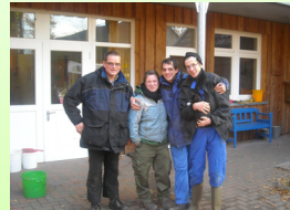
Mitarbeiter des Sonnenhofs